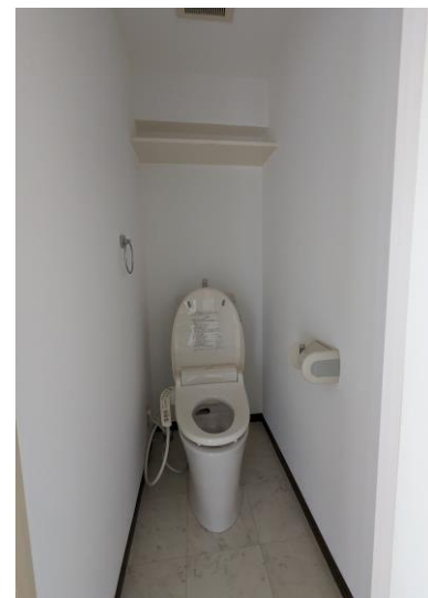
トイレ (ウォッシュレット)